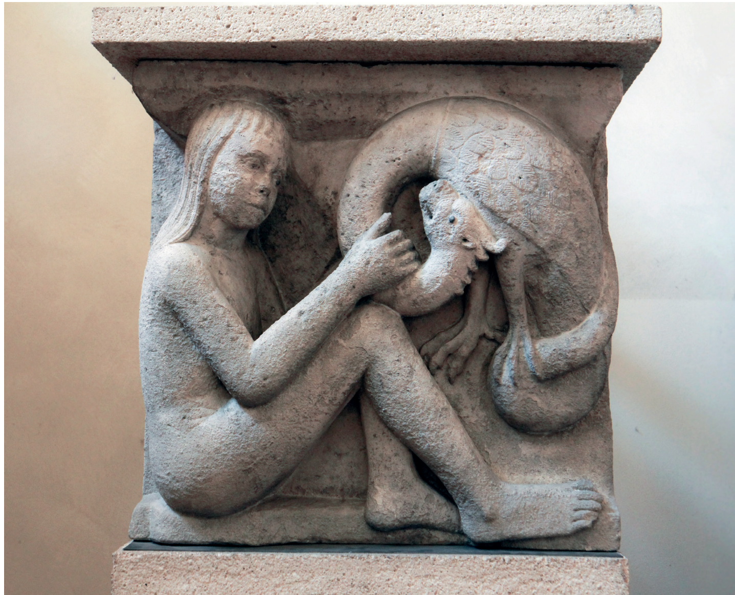
Il fanciullo con il drago

Tanto tempo fa, in un periodo chiamato Medioevo, gli uomini pensavano che ai confini della Terra abitassero dei popoli favolosi e straordinari; uno di questi popoli era quello degli Psilli, uomini famosi per essere immuni al morso dei serpenti e dei draghi tanto che i bambini, già da piccoli giocavano con queste creature senza averne alcuna paura. Le storie di questi popoli e di tanti altri sono raccontate nel Duomo di Modena, scolpite nella pietra.